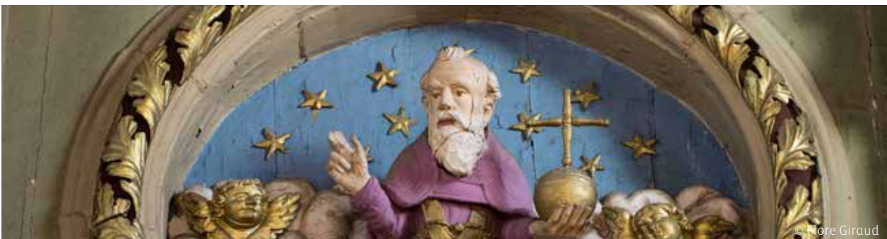
Église Saint-Martin-sur-Arve, Sallanches (74)

Ils ne font pas partie des personnages sculptés, ne sont pas sur les fresques, pas plus que sur les bannières ou les tentures. Et pourtant, ce qui fait la force de vie du baroque, ce sont eux... Ces fidèles, confrères, artisans et artistes, travaillant avec passion ou dépensant sans compter pour leur église ou leur chapelle. Autrefois pour construire, à présent pour restaurer. Regardez bien, derrière chaque pierre, chaque décor, ce sont eux qu'il faut voir.