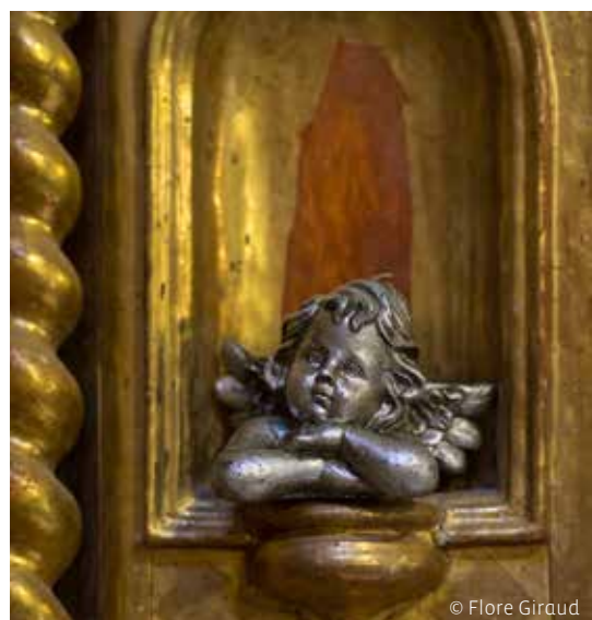
Église de la Sainte Trinité, Les Contamines-Montjoie (74)