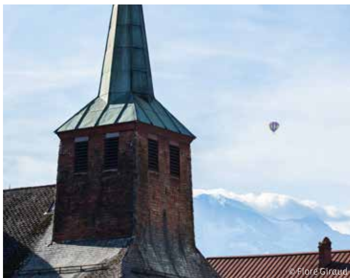
Clocher de l'église Saint-Martin-sur-Arve, Sallanches (74)

Comme toutes les belles histoires, celle de l'art baroque commence par « il était une foi »... Car c'est bien là, dans la volonté de glorifier Dieu et de raviver la foi chrétienne que cet art éclatant prend sa source. Mais, en vous penchant sur le sujet, vous découvrirez l'imaginaire et l'espérance des communautés montagnardes d'antan et vous apprendrez que le Tout-Puissant n'est pas toujours celui que l'on croit !