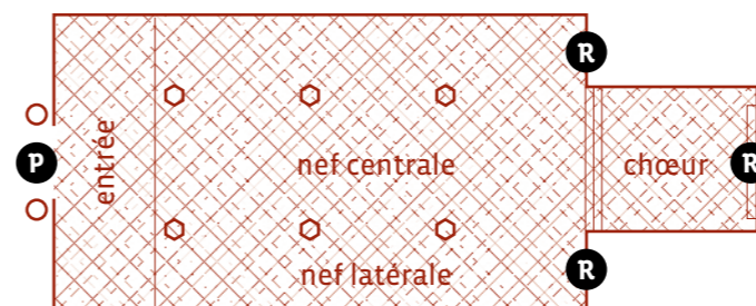
R retable P portail

B. 14 anges (3 peints sur le tableau; 4 complets et 7 têtes sculptés). Tous ont les ailes dorées. C. Au centre, saint Jean-Baptiste porte un agneau, et à gauche, saint Antoine est accompagné d'un petit cochon noir (en arrière de sa jambe gauche).