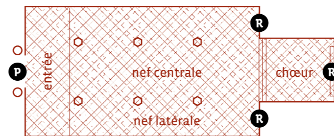
R retable P portail