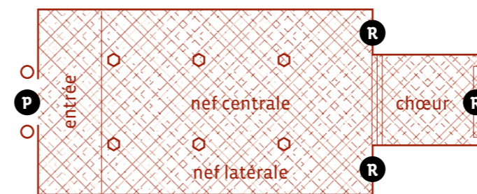
R retable P portail