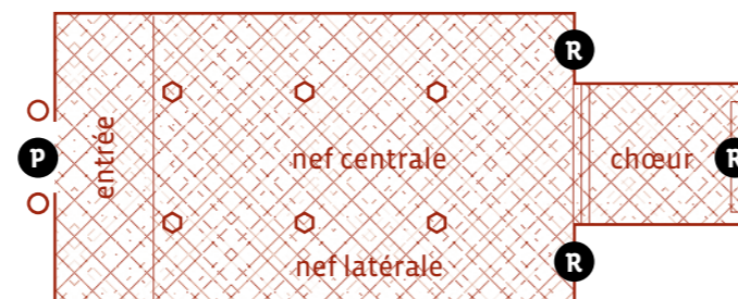
R retable P portail

L'église construite autour d'un premier plan roman comportait en plus d'une nef et d'un clocher, un chœur situé à l'Est, soit du côté de la vallée. Entre 1667 et 1673, elle fut agrandie, le nouveau chœur reçu un fond plat et le clocher fut englobé dans un autre plus imposant. On en profita pour changer l'orientation de l'édifice et l'entrée se fit dès lors en passant sous le clocher 1 .