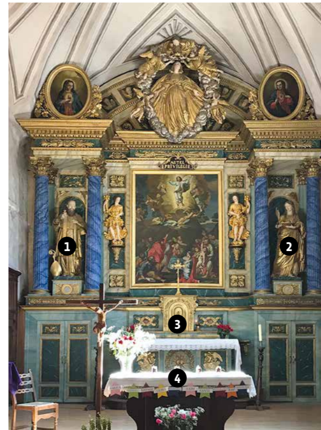
1 Saint-François de Sales 2 Sainte-Agathe 3 tabernacle 4 autel

* Les évangélistes sont les hommes qui ont écrit l'histoire de la vie de Jésus.